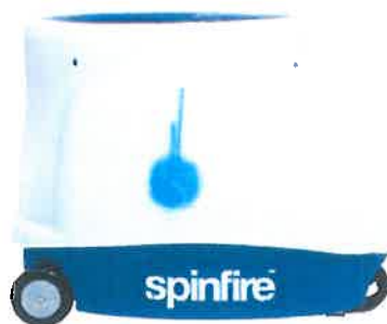
Ballbehälter für Transport/Lagerung umgestülpt

Der Ballbehälter kann für den Spielbetrieb aufrecht aufgesetzt bzw. für Transport/Lagerung umgestülpt werden. (Natürlich kann er, falls erforderlich, auch ganz abgenommen werden.) Zum Aufsetzen richten Sie den Behälter korrekt aus und drücken ihn nach unten, bis er einrastet.